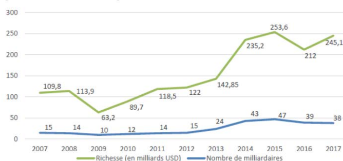
Evolution du nombre de milliardaires français et leur richesse cumulée (en milliards dollars USD)

Le phénomène s'observe également dans les autres pays. Ainsi, « 82 % de la croissance des richesses créées dans le monde l'année dernière ont profité aux 1 % les plus riches, alors que la situation n'a pas évolué pour les 50 % les plus pauvres. »