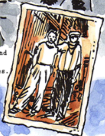
Vichy livre 48 otages, la plupart syndicalistes et communistes. 27 sont de Châteaubriand, 16 de Nantes et 5 du Mont-Valérien.