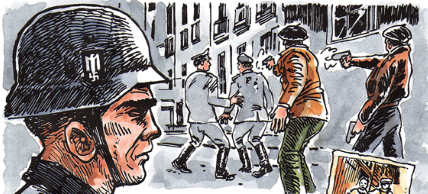
20 octobre 1941: exécution d'un officier Allemand par la résistance Française. Hitler exige des représailles et ordonne l'exécution de 150 otages.